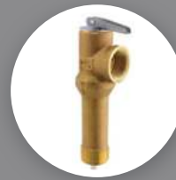
Ilustración genérica, sólo para referencia.